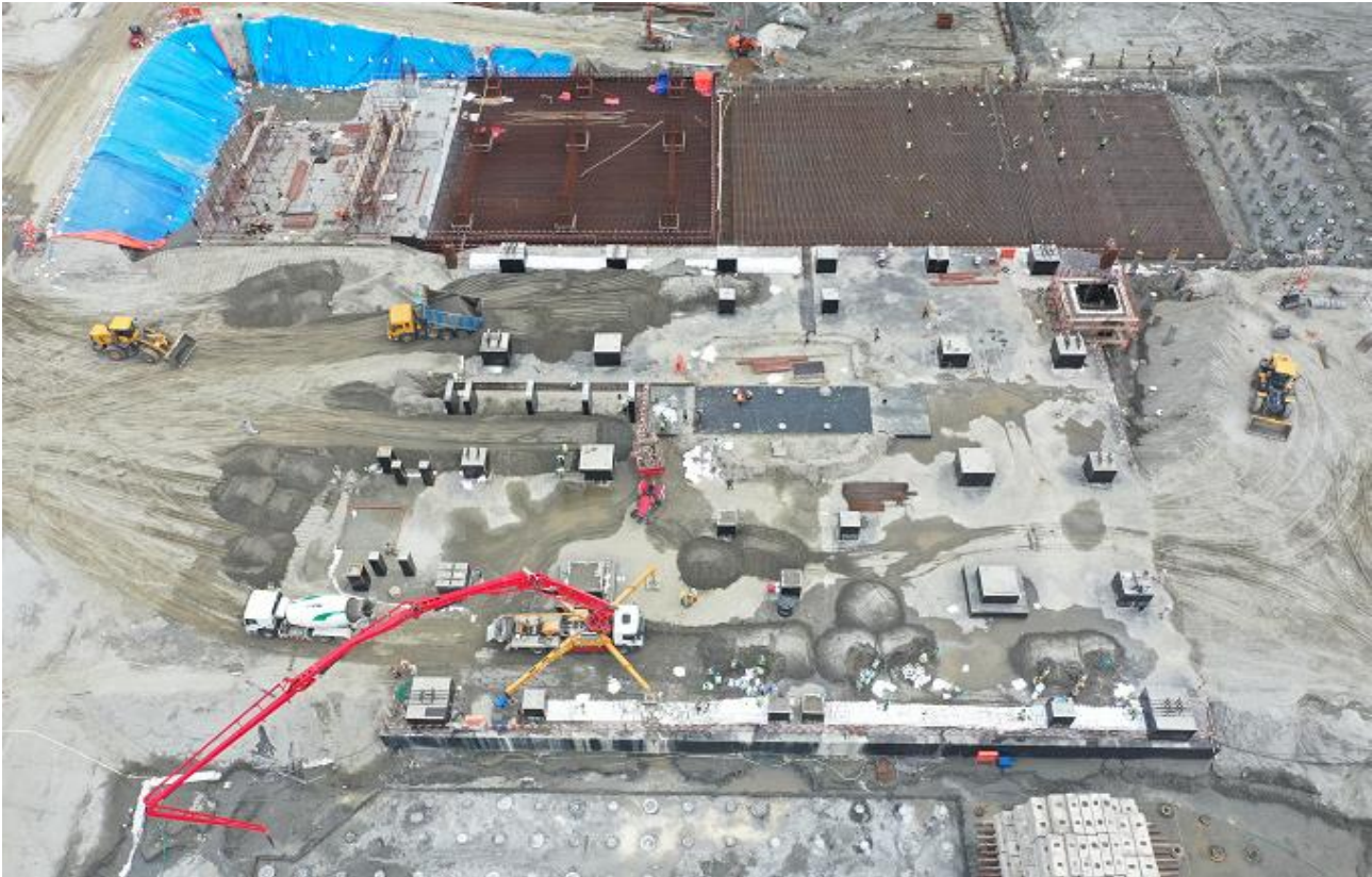
Admin, Engineering Building and Multi-Purpose House [Foundation Works]