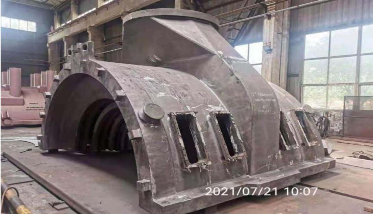
Paint Inspection of stator frame of #2 generator equipment