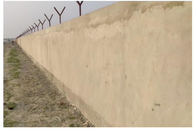
প্রকল্প এলাকার বাউন্ডারী ওয়াল নির্মাণ