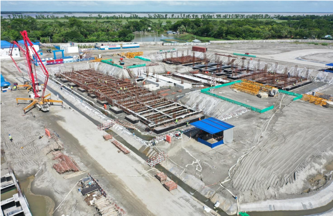
Workshop Building [Foundation Works]