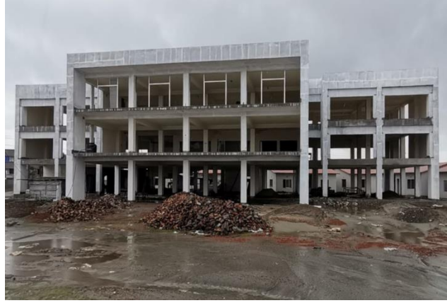
পুনর্বাসন (কমিউনিটি হল কাম সাইক্লোন শেল্টার নির্মাণ)