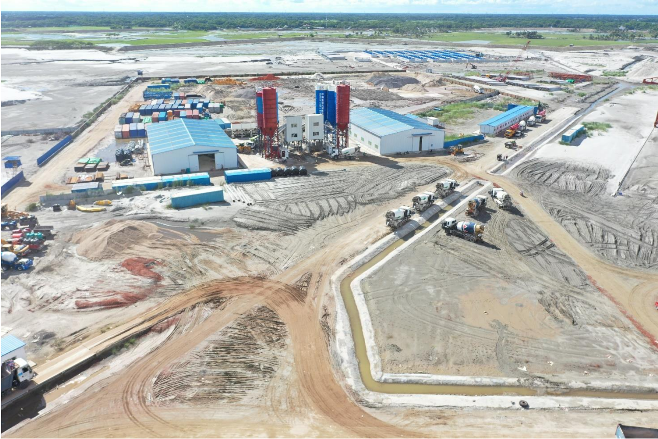
Pilling Works at Chimney Area