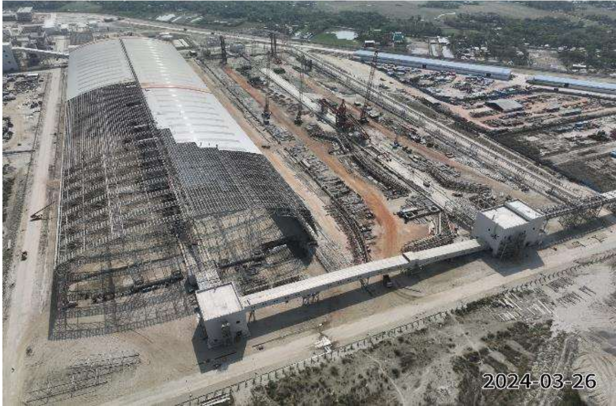
Coal Conveyer Belt and Transfer Tower (Structure Works)