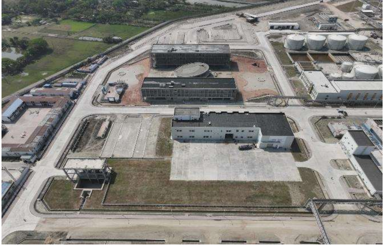
Township (Structure Work of VVIP Rest house & Executive Guest House)