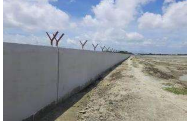
প্রকল্প এলাকার বাউন্ডারি ওয়াল নির্মাণ