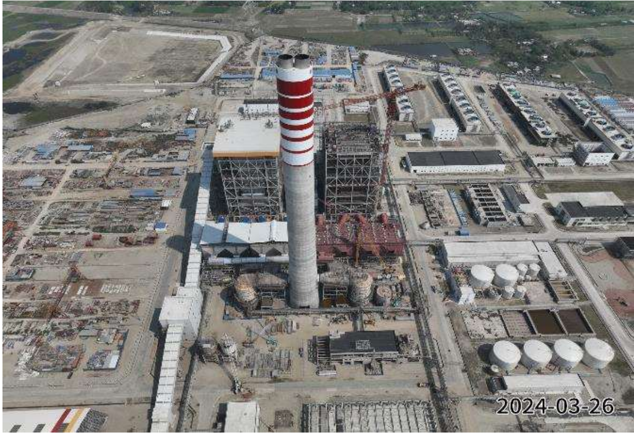
Boiler Turbine Generator area [Superstructure works]