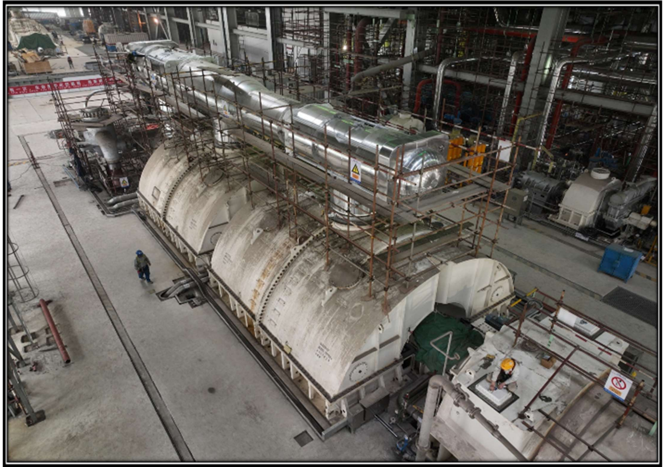
Turbine Generator (2nd Unit)