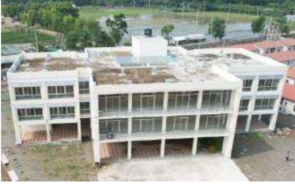
পুনর্বাসন (কমিউনিটি হল কাম সাইক্লোন শেল্টার নির্মাণ)