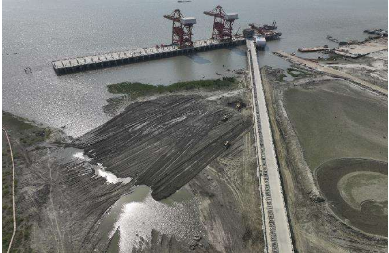
Coal Handling Jetty