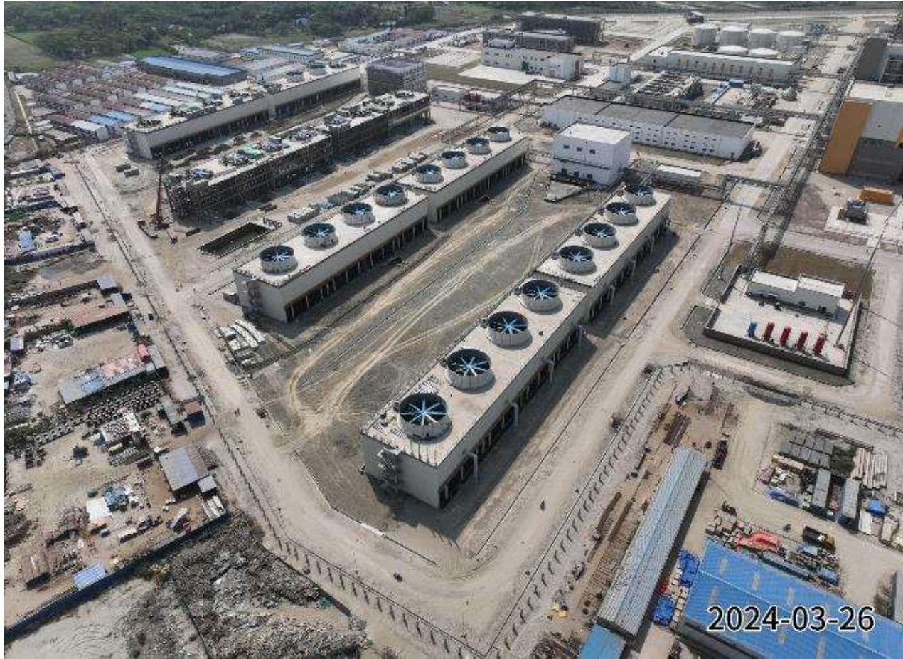
Water treatment area