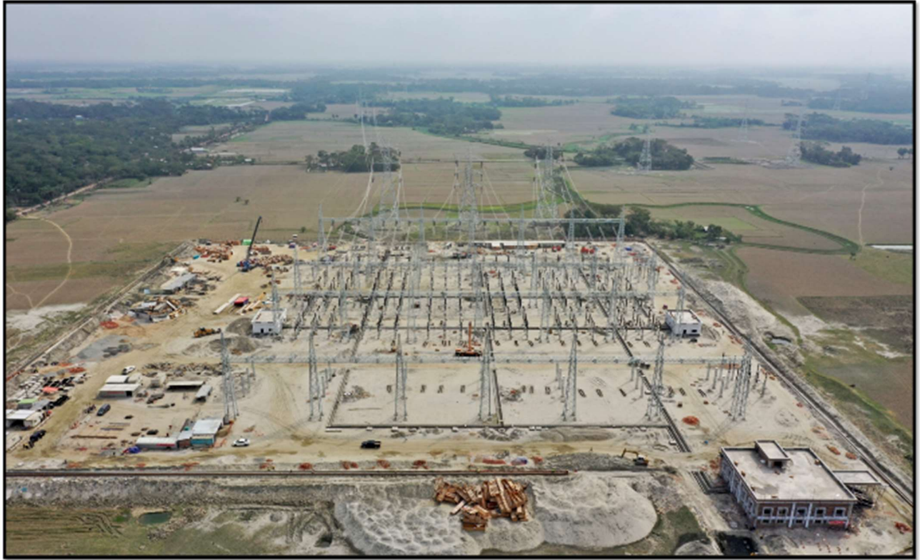
Amtoli 400kV Switching Station (Civil & Erection work)