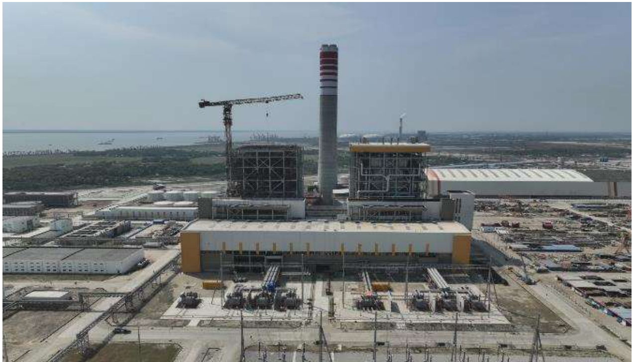
Turbine Generator (1st Unit)